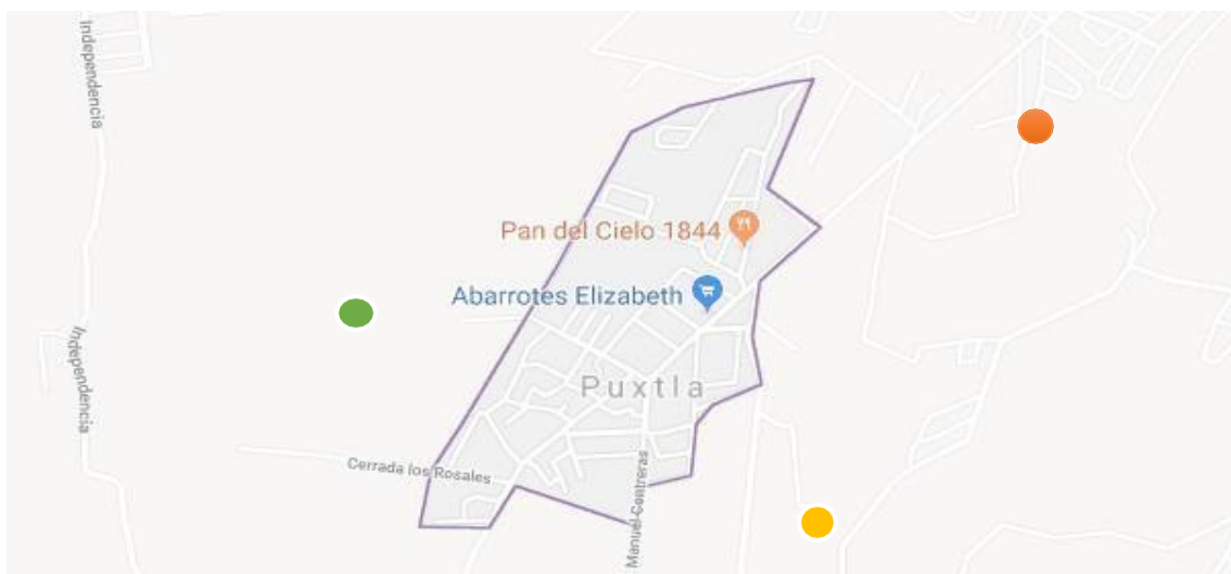
Mapa 1. Puxtla y ubicación de campos de cultivo