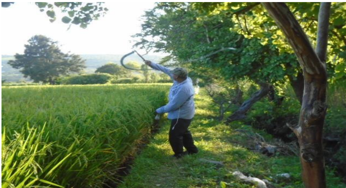
Foto 25. Campo de arroz y pajarero