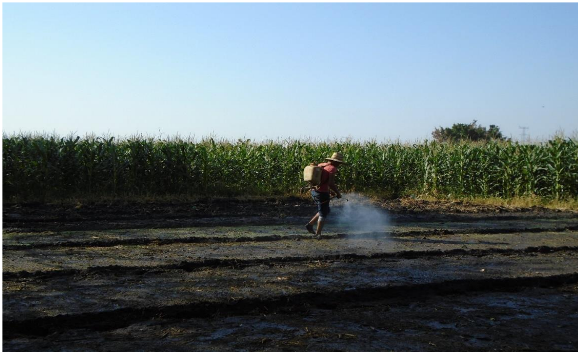
Foto 2. Productor colocando herbicida sobre el pachol para evitar el crecimiento de maleza

Fuente: Trabajo de campo. Aylin Rosas Villanueva, marzo 2019. Campo Tercero.