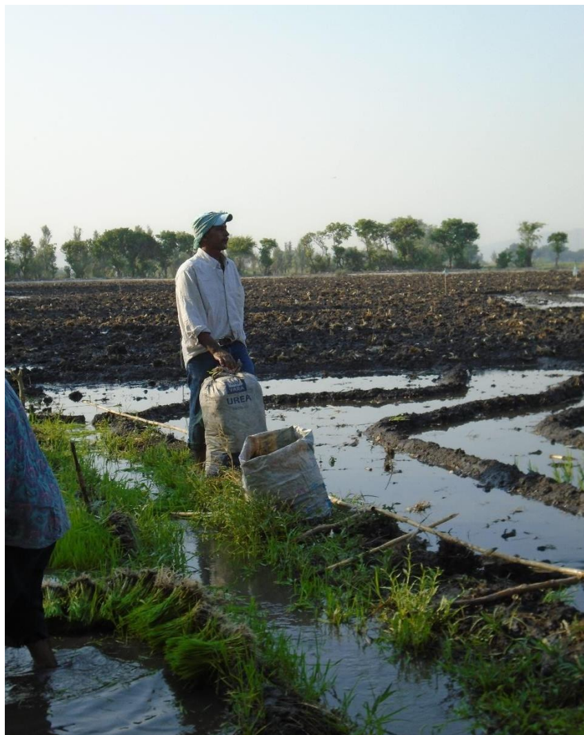
Campo tercero.