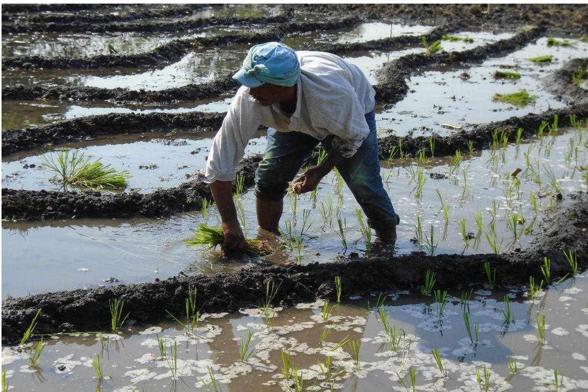
Foto 18. Plantador de arroz, de la comunidad de Ahuehueyo, trabajando en Puxtla