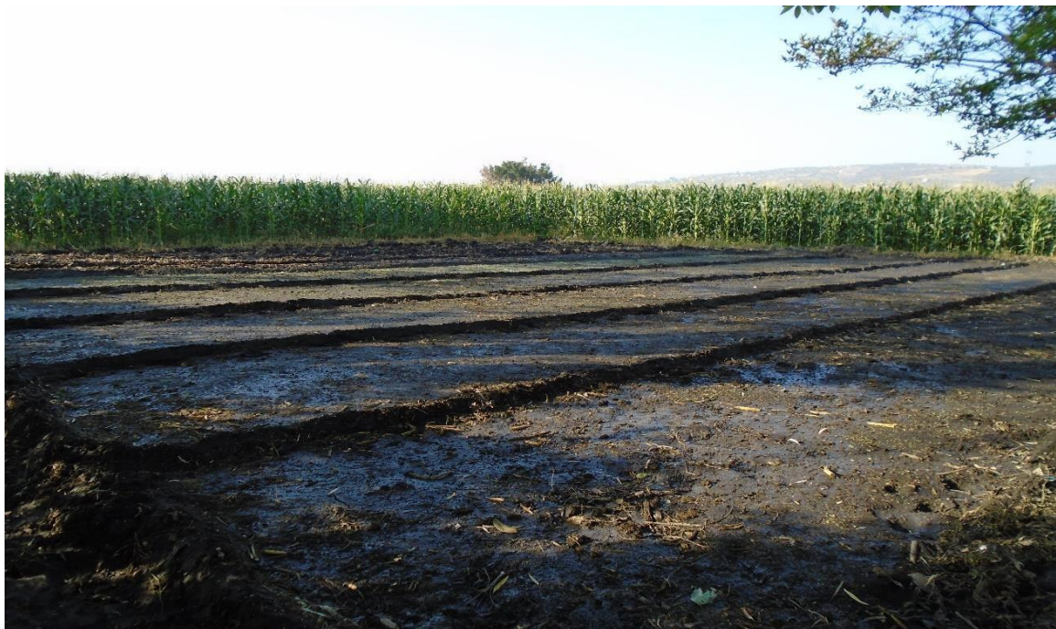
Foto 1. Camas de pachol o almácigo, Puxtla