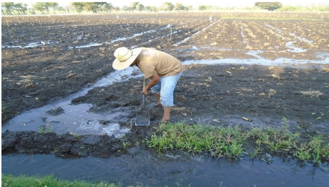
Foto 9. Aguador metiendo el agua antes del comienzo del aborde