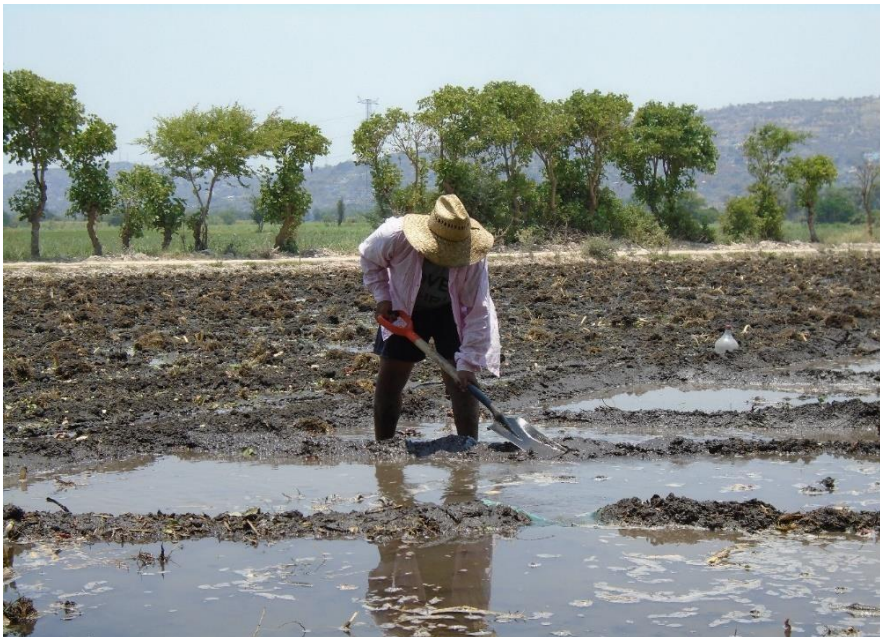
Foto 14. Abordador aplanando el borde