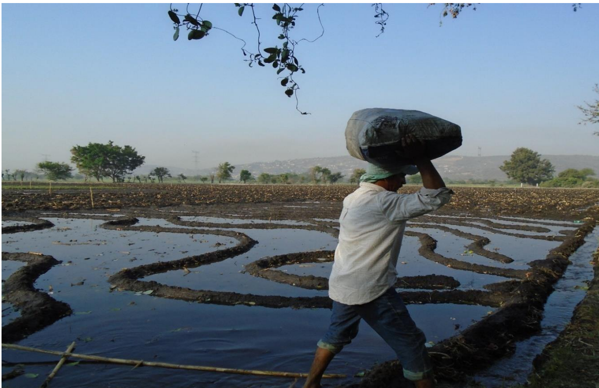
Foto 17. Plantador con su costal lleno de pachol, listo para entrar a plantar