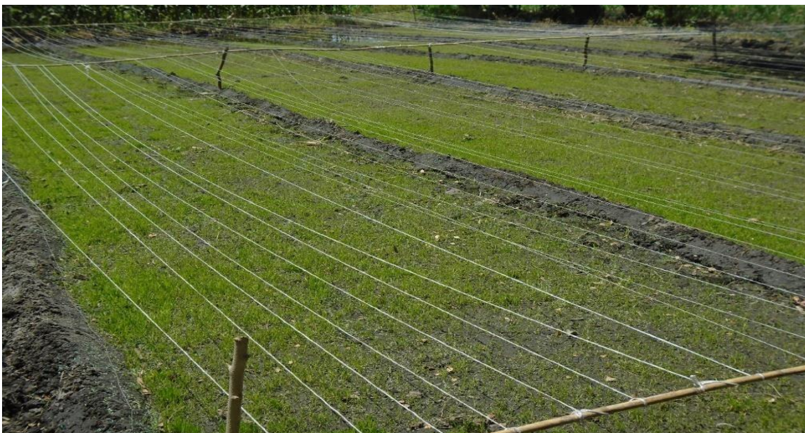
Foto 3. Hilos sobre el pachol para evitar que los pájaros lo coman