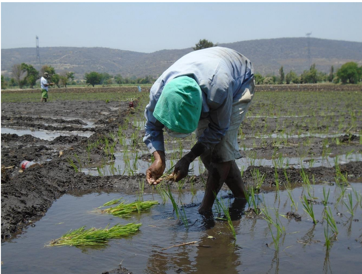
Foto 19. Plantador realizando la tarea de trasplante