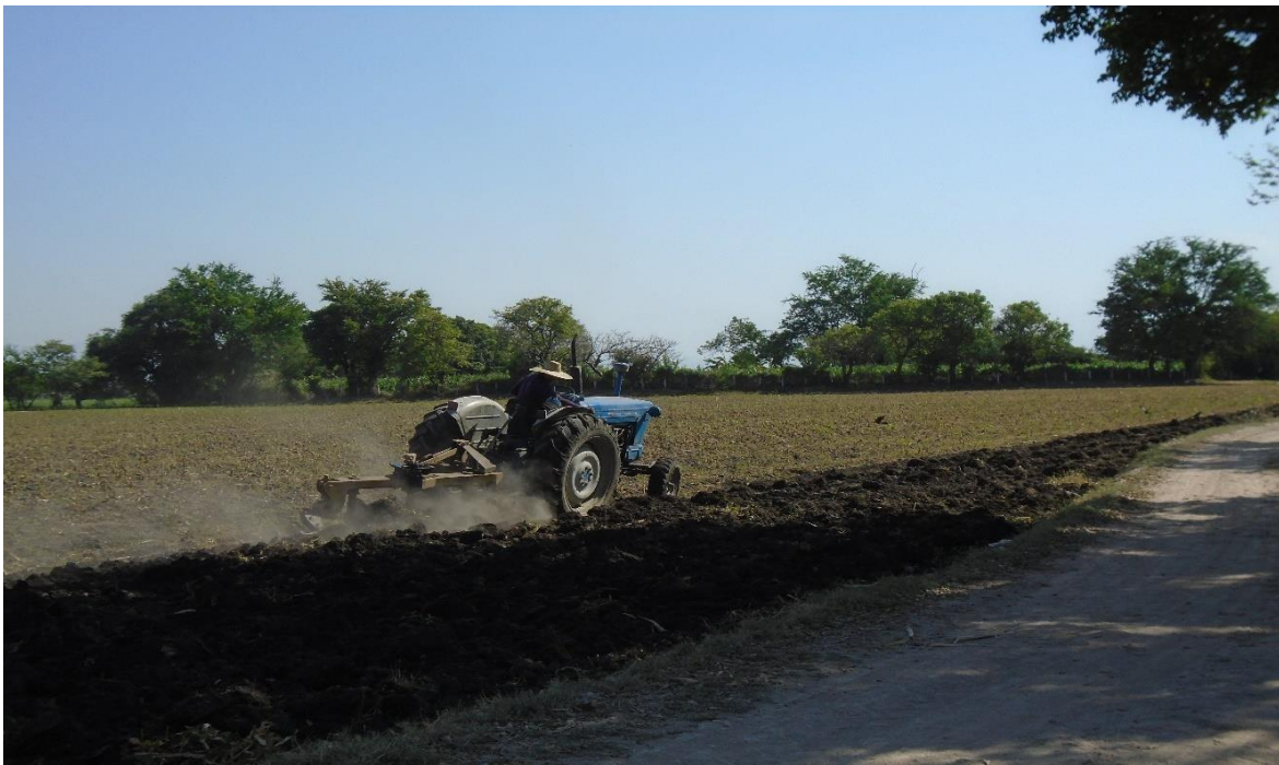
Fuente: Trabajo de campo. Aylin Rosas Villanueva, abril 2019. Campo Tercero.