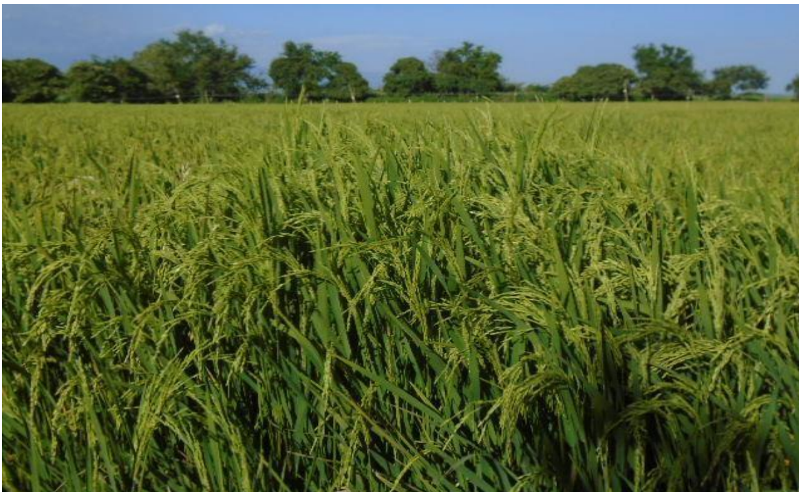
Foto 23. Nacimiento de las espigas