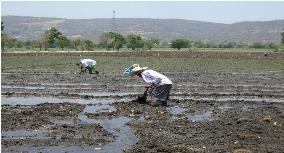
Foto 12. Abordador de Ahuehueyo, en Puxtla