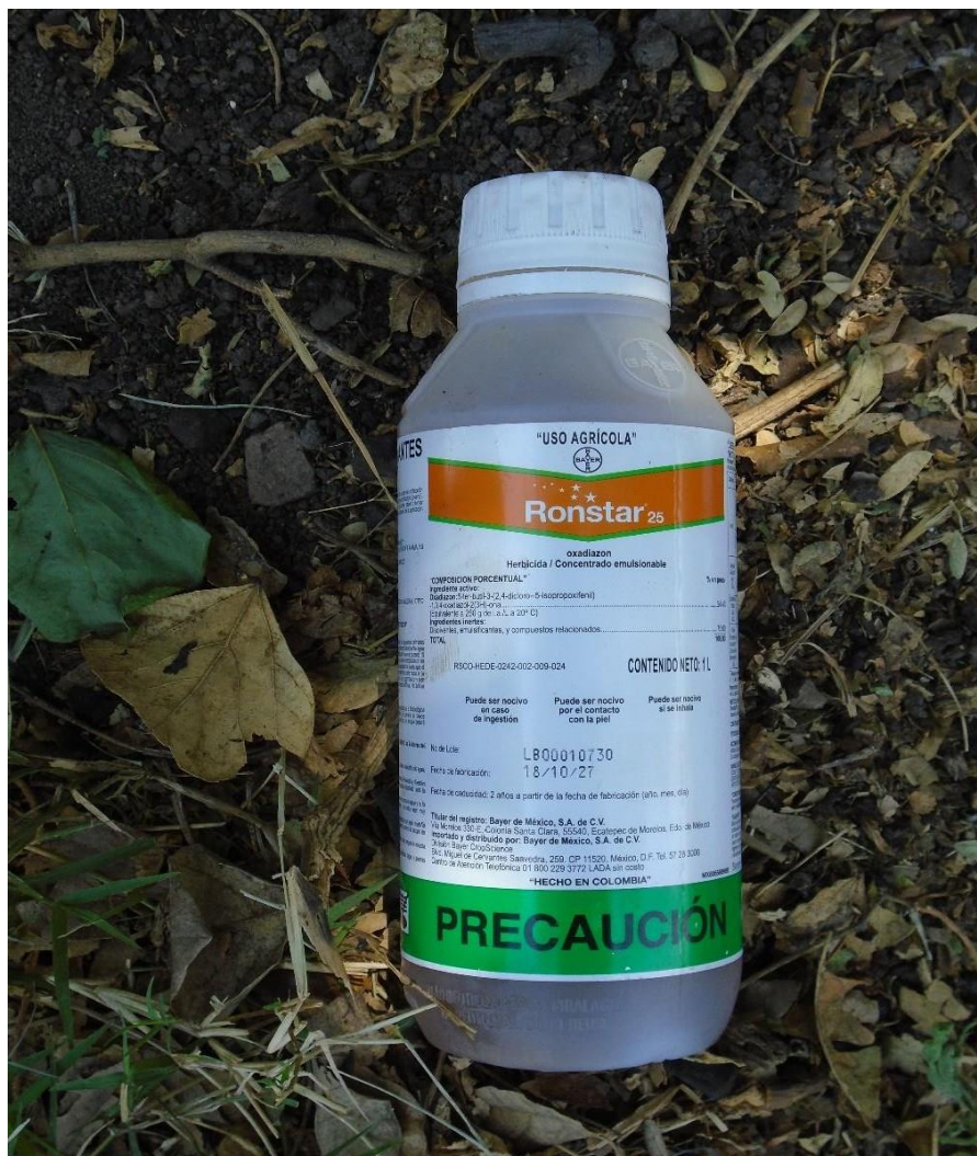
Fuente: Trabajo de campo. Aylin Rosas Villanueva, mayo 2019. Campo Tercero.