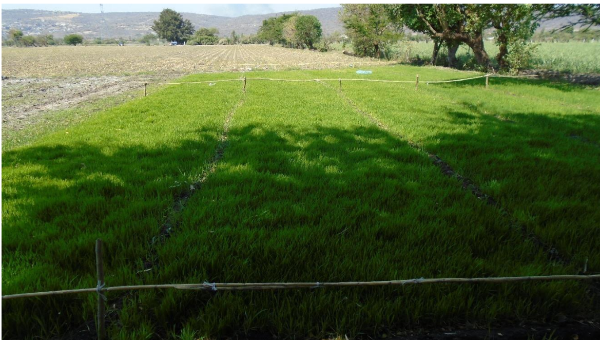
Foto 4. Pachol ya nacido, sin hilos