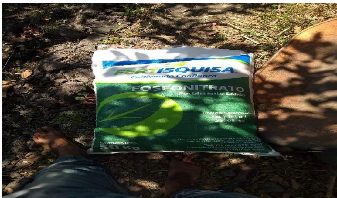
Foto 21. Fosfonitrato, abono para el pachol.