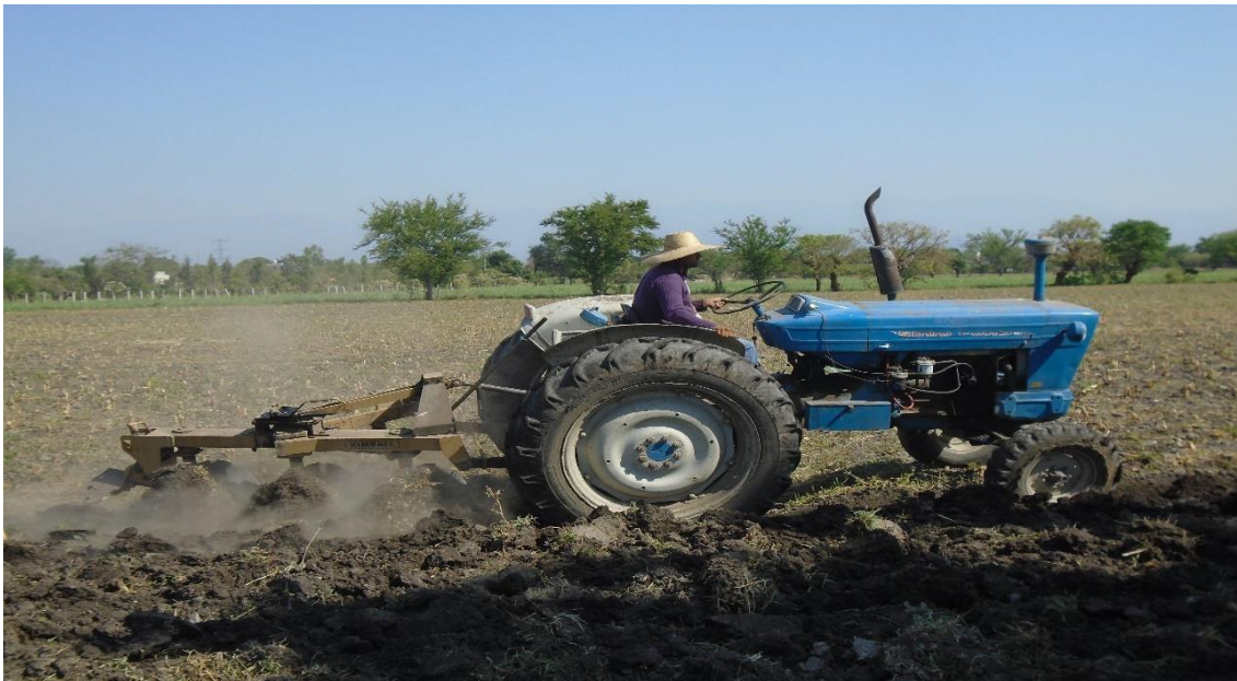
Fuente: Trabajo de campo. Aylin Rosas Villanueva, abril 2019. Campo Tercero.