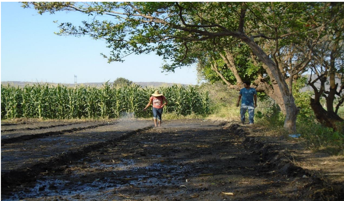
Foto 5. Productores fumigando herbicida sobre pachol, transmisión de conocimientos

Fuente: Trabajo de campo. Aylin Rosas Villanueva, marzo 2019. Campo Tercero.