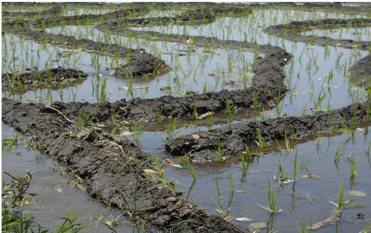
Foto 10. Trabajo de un abordador y plantador, bocas para que permitan la nivelación y circulación del agua