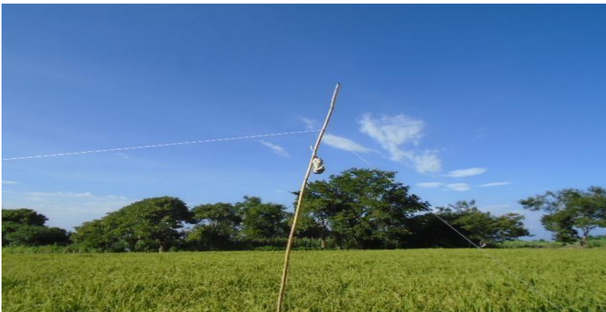
Foto 24. sistema de pajareo con bote de aluminio