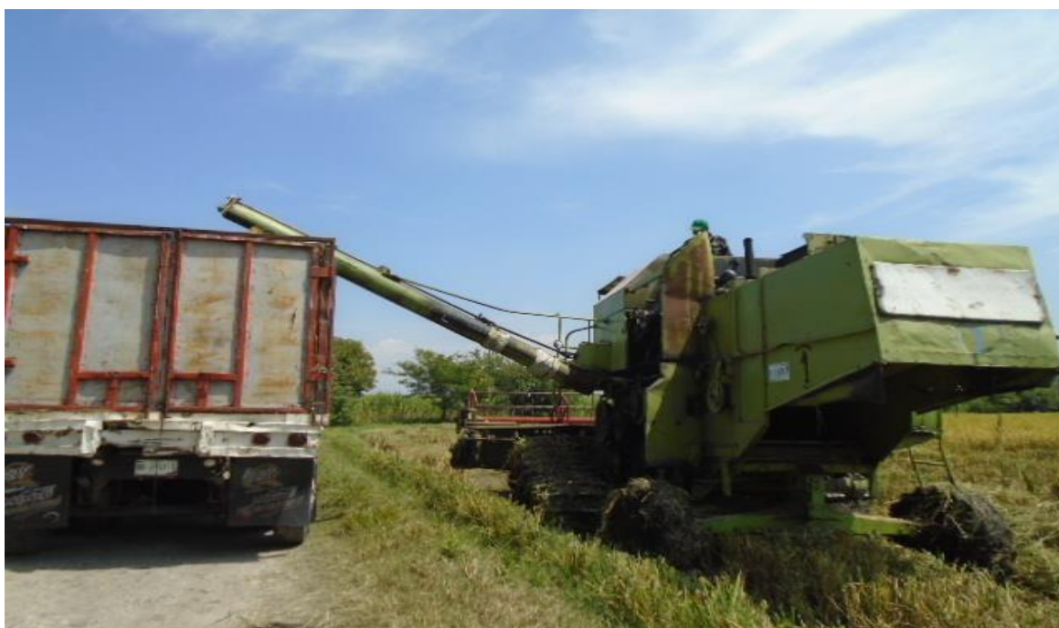
Foto 26. Cosecha mecanizada con trilladora y camión para el grano de arroz