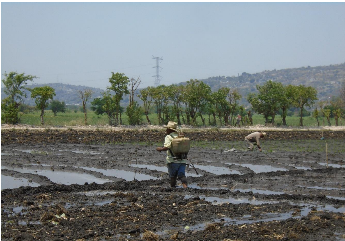
Foto 8. Aguador fumigando con sellador el trabajo del abordador, para después plantar