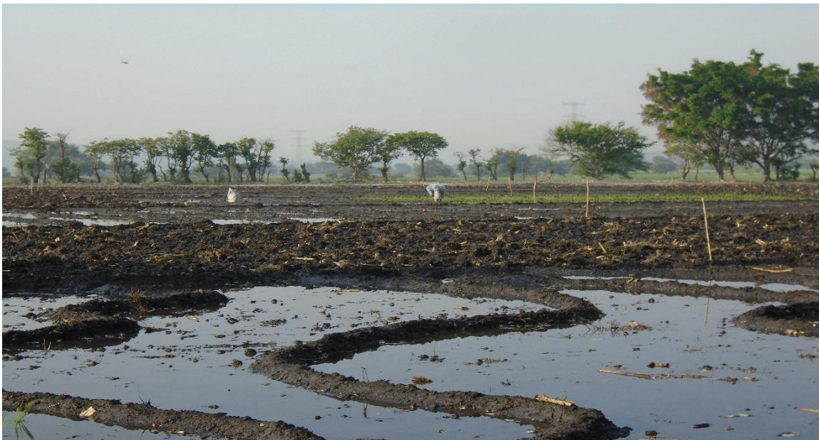
Fuente: Trabajo de campo. Aylin Rosas Villanueva, abril 2019. Campo Tercero.