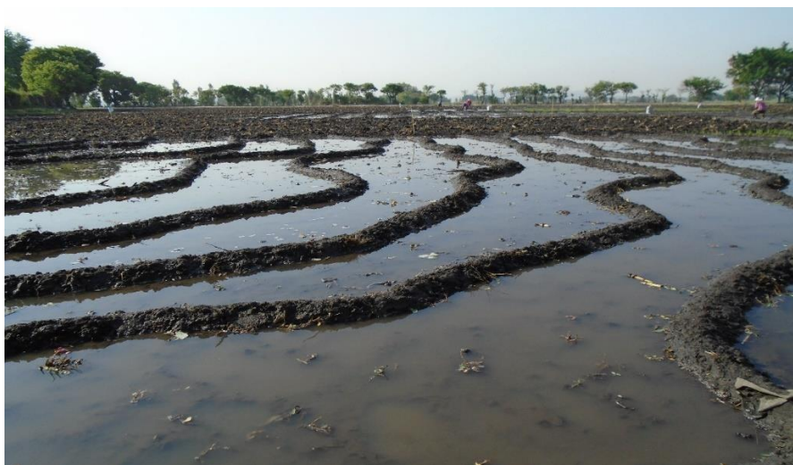
Foto 12. Un cuarto de tarea abordada por un jornalero