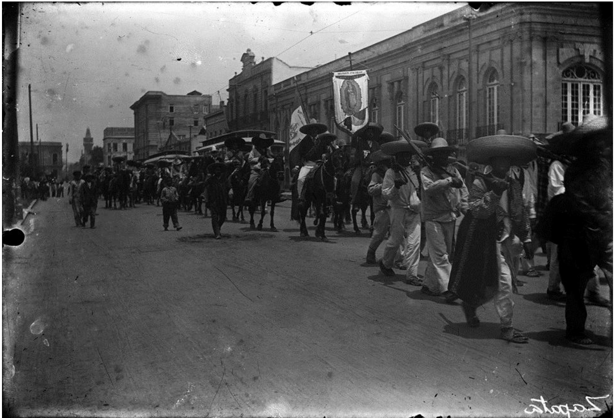
Imagen 1. Casasola, Entrada de tropas zapatistas a la Ciudad de México , 25 de noviembre de 1914, en: Fondo Casasola, Fototeca Nacional del INAH, disponible en: http://www.mediateca.inah.gob.mx/islandora_74/islandora/object/fotografia%3A13321 (consulta: 25/08/2019).

Uno de los momentos más significativos de inicios del siglo XX en México es la entrada del Ejército Libertador del Sur, constituido principalmente por comunidades campesinas del estado de Morelos, a la ciudad de México a finales de 1914, portando como bandera estandartes de la Virgen de Guadalupe. Momentos capturados en las fotografías de los hermanos Casasola y que hoy forman parte de nuestro imaginario colectivo como distintivo del movimiento suriano. Estos estandartes eran depositarios de una devoción común, y reflejan la cultura y la religiosidad de los pueblos de la zona zapatista.