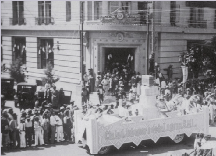
La Verbena de La Raza, 1927. Archivo Municipal de Torreón, Fondo H.H. Miller, MX.AMDT. HHM.C4.S4.F03, F14, F19 y F20, y MX.AMDT.HHM.C4.S4. F13.NEG y F19.NEG.