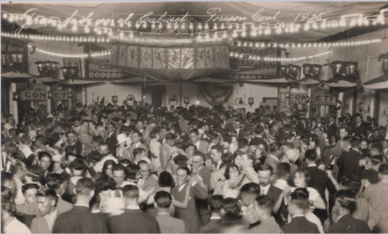
Álbum Feria del Algodón, 1925.