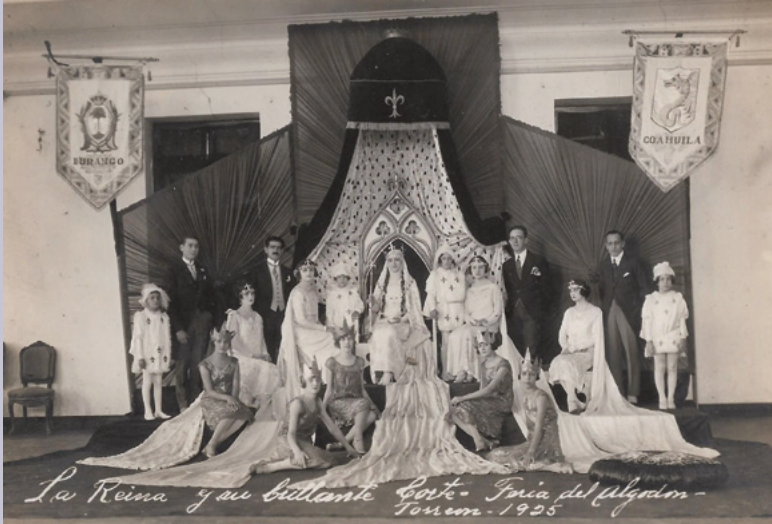
La Reina y su brillante Corte - Feria del Algodón - Toluca - 1925