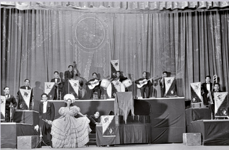
Página opuesta: Teatro Isauro Martínez de Torreón. Arriba: Interior del Teatro Isauro Martínez . y espectáculo en el mismo recinto, c. 1930.