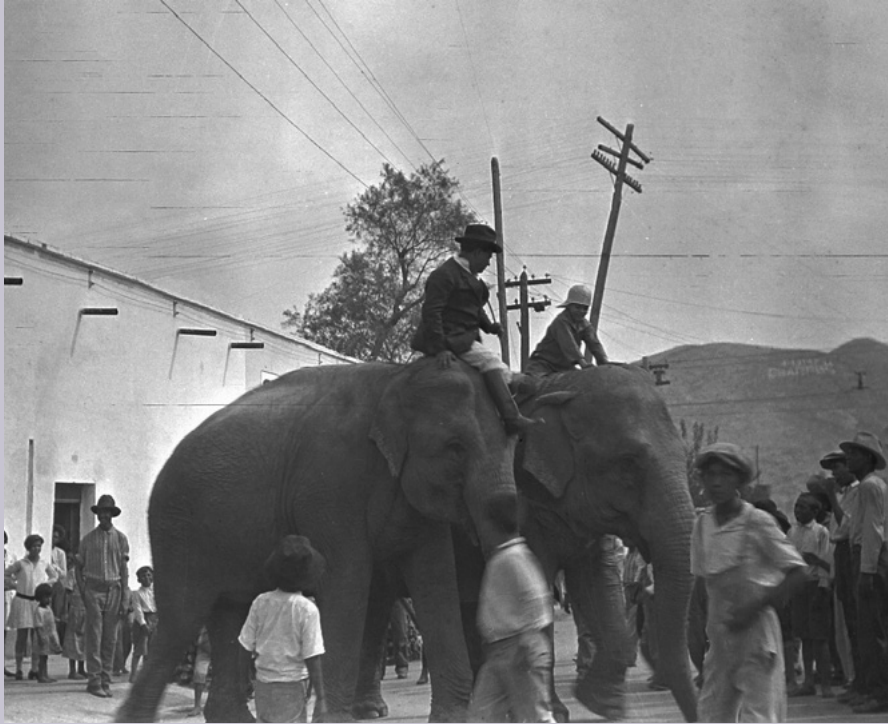
Elefantes en Torreón, 17 de septiembre de 1927. Archivo Municipal de Torreón, Fondo H.H. Miller, MX.AMDT.HHM.C5.S2.F33.