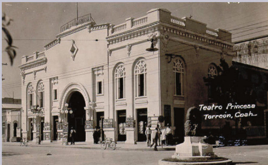
Teatro Princesa de Torreón, años veinte.