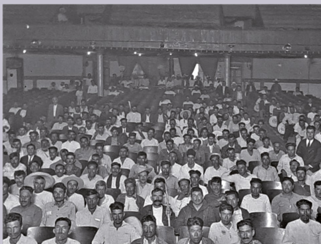
Arriba: manifestación frente al Teatro Princesa de Torreón ; abajo: pleno agrario en el mismo recinto, años treinta.