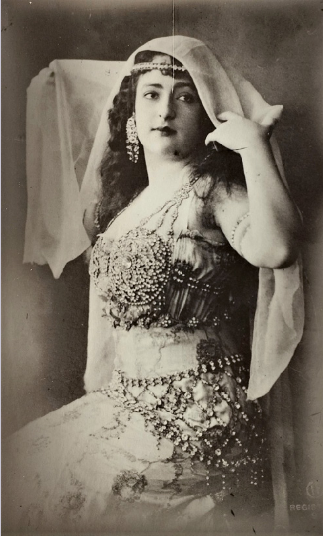
Mimi Derba , c. 1920.