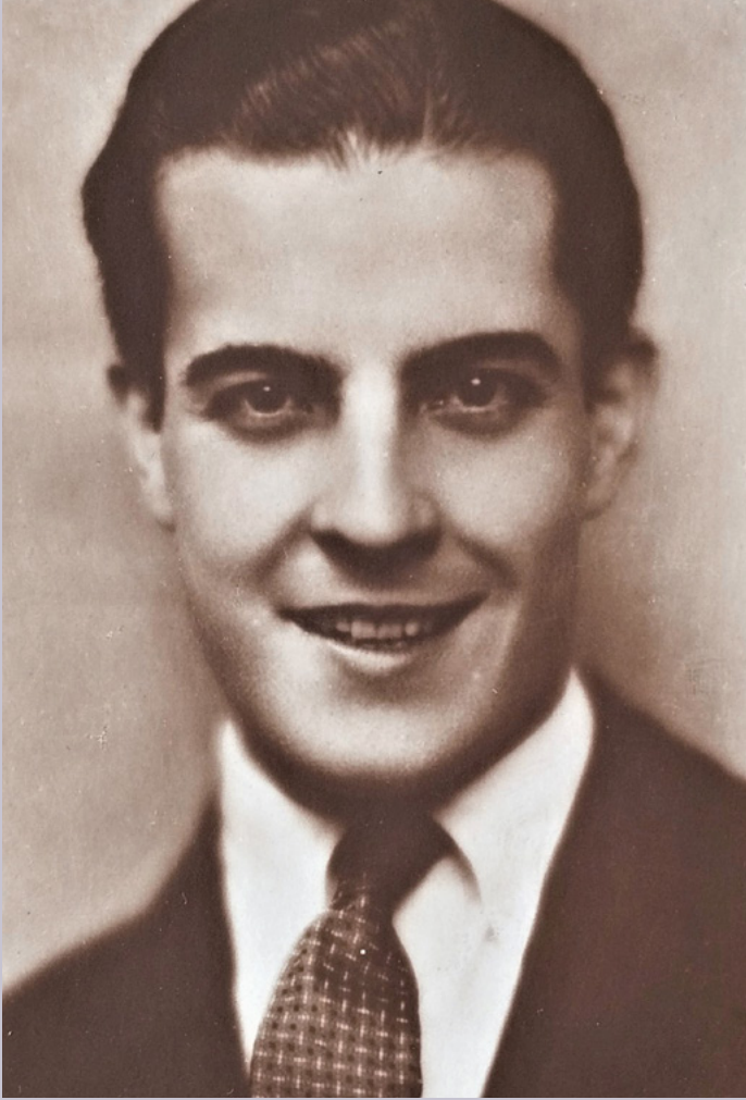
Ramón Novarro. Colección particular.