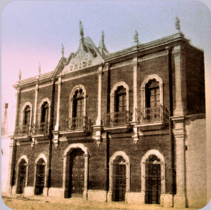
El Teatro Unión de Gómez Palacio.