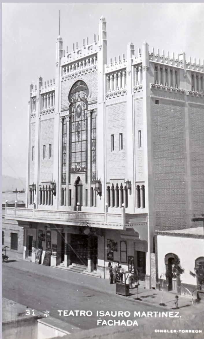
31 * TEATRO ISAURO MARTINEZ. FACHADA