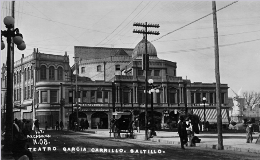
Teatro García Carrillo de Saltillo.