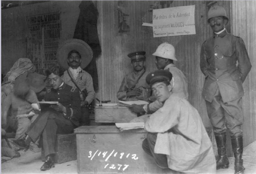
Regimiento de Caballería de Montaña del ejército federal , 14 de marzo de 1912. Al fondo, en el cartel en el muro alcanza a leerse: “No olviden que en esta Plaza de Toros habrá cinematógrafo todos los lunes”.