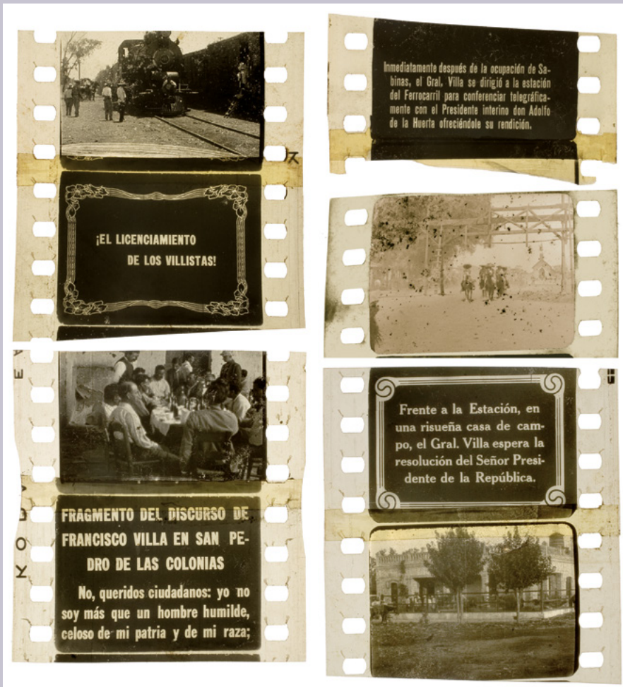
Fotogramas e intertítulos de una película sobre la rendición de Francisco Villa, 1920. Filmoteca UNAM / Fundación Carmen Toscano, Fondo Salvador Toscano.