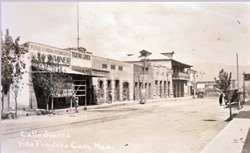
Arriba: Teatro Herrera de Torreón, c. 1922, Archivo Municipal de Torreón, Fondo Miller, MX.AMDT.HHM.C9.S2.F36. Abajo: Teatro Lírico de Villa Frontera, colección Francisco Montellano / Fotofija.