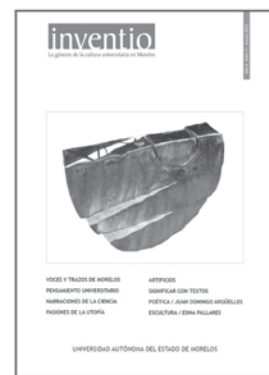
núm. 11 marzo 2010