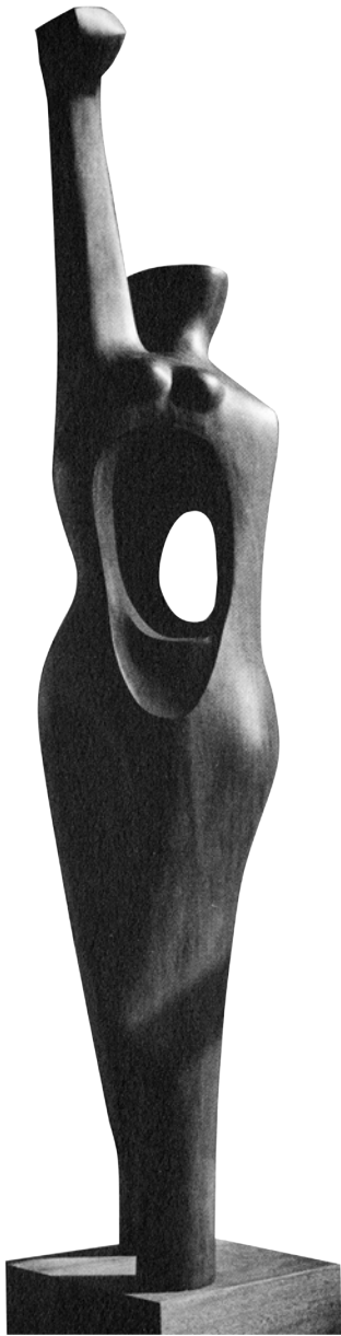
Homage to my young black sisters (Homenaje a mis jóvenes hermanas negras) (frontal) cedro, 182 cm, 1968