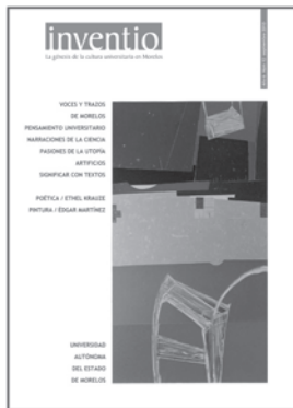
núm. 12 septiembre 2010