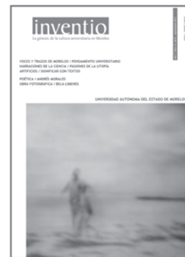
núm. 14 septiembre 2011

Inventio , año 8, número 15, octubre 2011 - marzo 2012