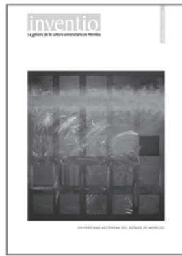
núm. 7 marzo 2008