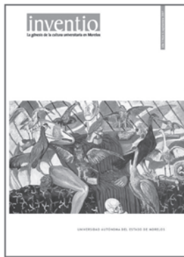
núm. 6 septiembre 2007