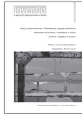
núm. 8 septiembre 2008