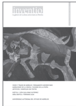
núm. 13 marzo 2011