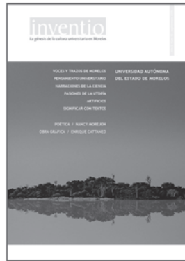
núm. 10 septiembre 2009