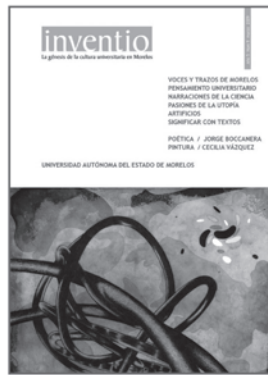
núm. 9 marzo 2009