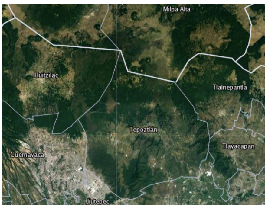
Mapa 1. Ubicación del municipio de Tepoztlán

kilómetros de la ciudad de México y a 16 kilómetros de la ciudad de Cuernavaca, capital del estado. Su nombre proviene de las raíces etimológicas del náhuatl: tetl (piedra), poz (quebrado) y tlan (abundancia) y significa “ lugar de piedras quebradas ” 14 . En el Códice Mendoza su jeroglífico representa un hacha de metal cuyo mango está incrustado en una montaña 15 . Así mismo, es un pueblo que acoge por nombre el de su dios prehispánico, Tepuztécatl (Alvarado, Et. Al., 2017).