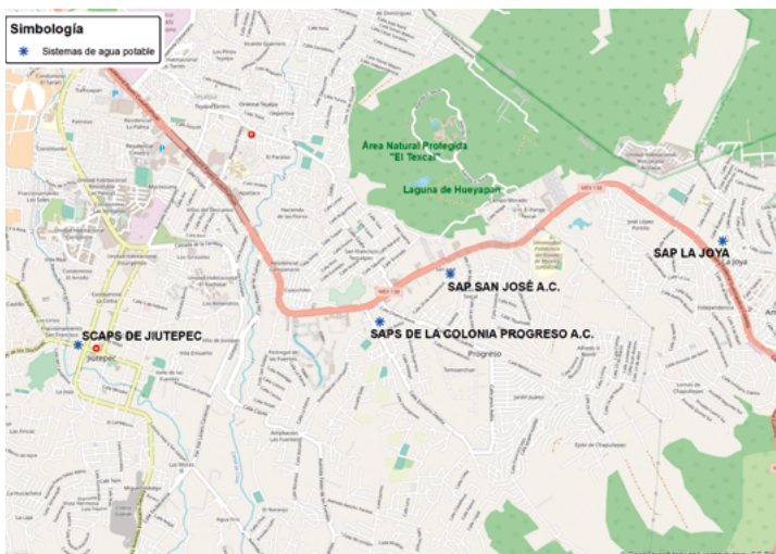
Figura 1. Zona de estudio 4

así como a las colonias La Joya, Álvaro Leonel, Las Tetillas y Amador Salazar en el municipio de Yautepec (González-Flores, 2012).