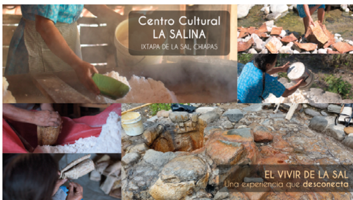
Figura 1. Propuesta de turismo experiencial en el CCLS

recurso cultural que poseen los habitantes de ese microterritorio. Se presentan de esa manera con el fin de llamar la atención a un sector específico de turistas.