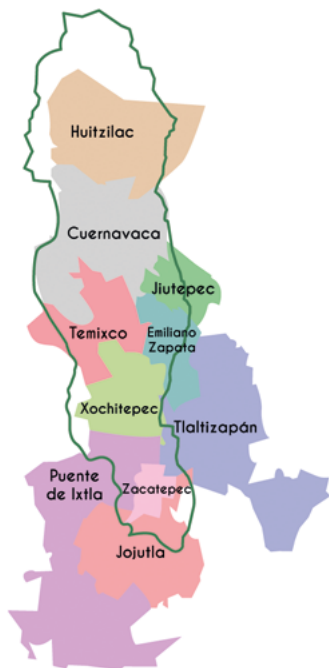
Figura 1. Municipios de Morelos que conforman la cuenca del río Apatlaco