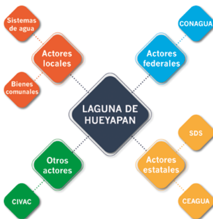
Figura 2. Mapa de actores clave

Hemos elegido esta técnica en el caso particular de la laguna, porque consideramos que nos permite conocer a una mayor profundidad cómo se gestan las relaciones sociohídricas entre actores, así como identificar los vacíos de información para el caso en particular. El análisis parte de las percepciones locales recabadas a través de entrevistas semiestructuradas de los representantes de los sistemas de agua más cercanos a la laguna y que mantienen un manejo independiente del municipio; nos referimos a las colonias Progreso y San José y al comisariado de los bienes comunales de Tejalpa (figura 2).