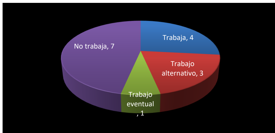
Grafica 5. Condición laboral actual

En la gráfica número 5 se puede apreciar la condición laboral actual de los pacientes entrevistados, en ésta se puede apreciar como la mayoría de ellos han de alguna manera continuando con su vida laboral, algunos en trabajos alternativos o eventuales que se encuentran dentro de sus posibilidades, el resto no trabaja actualmente