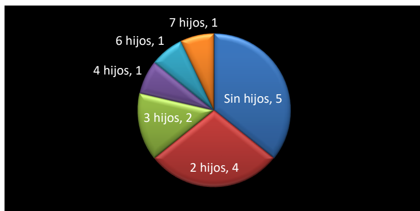
Gráfica 3. Número de hijos

En la gráfica número 3 se muestra el número de hijos que tienen los pacientes entrevistados, de los cuales: 5 no tienen ningún hijo, 4 de ellos tienen 2 hijos, 2 tienen 3 hijos, 1 tiene 4 hijos, 1 tiene 6 hijos y por ultimo un varón tiene 7 hijos