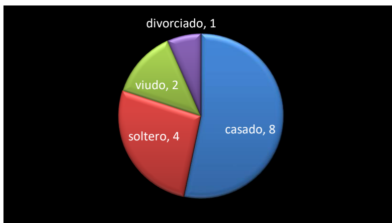
Gráfica 2. Estado civil

A continuación se grafica el estado civil de los pacientes entrevistados, 8 de ellos son casados, 4 solteros, 2 viudos y 1 divorciado.