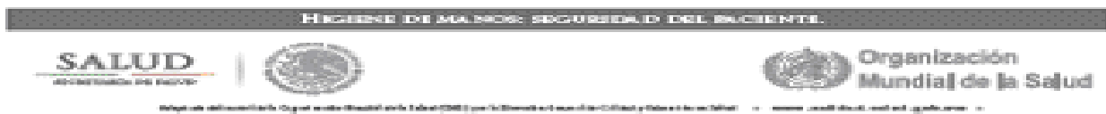
Figura: Higiene de manos, seguridad del paciente (Organización Mundial de la Salud).