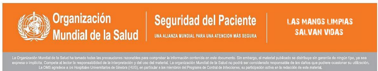
Figura: seguridad del paciente, acción de higiene de manos. (Organización Mundial de la Salud)