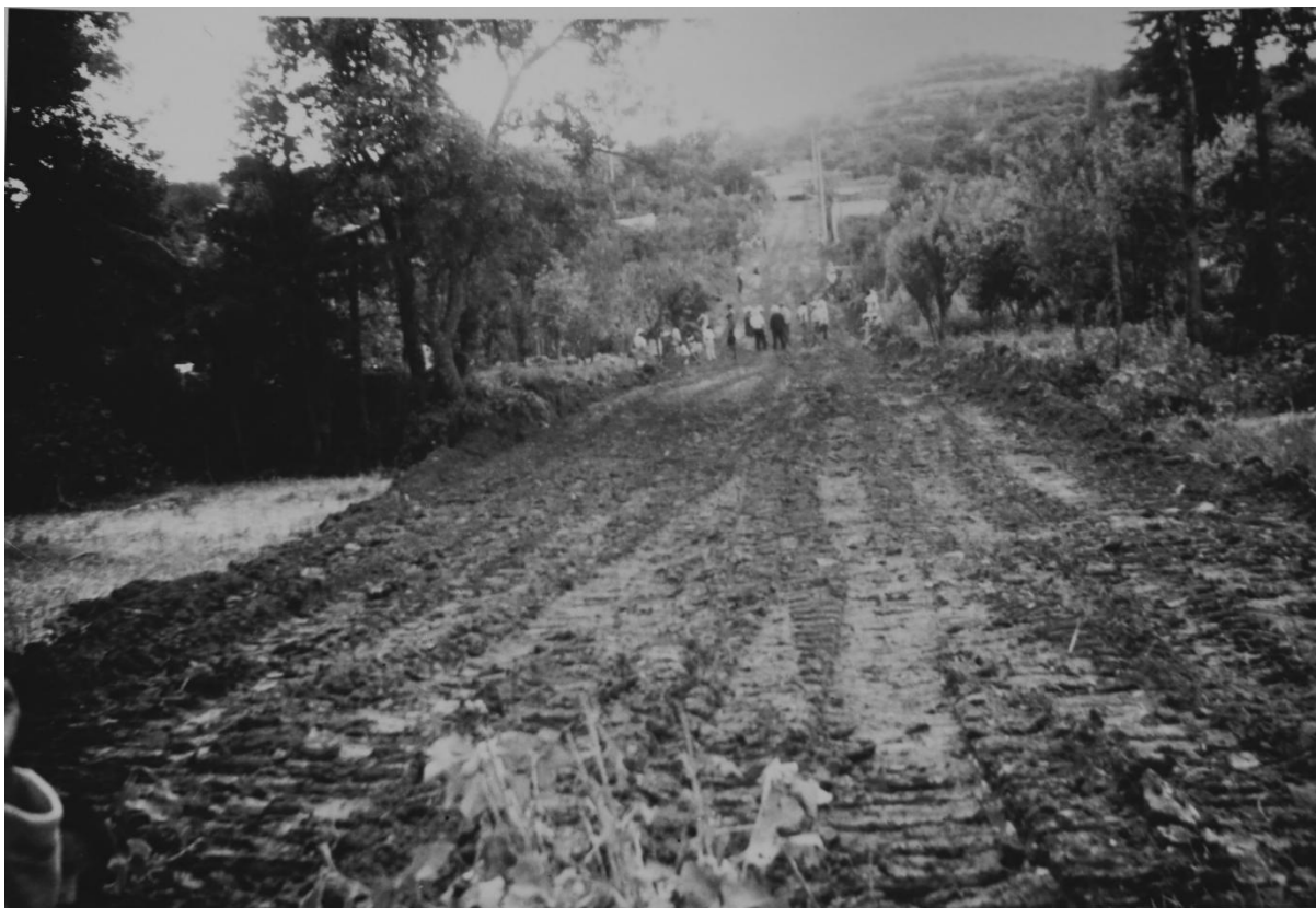
Fotografía de la apertura de las calles. San Juan Totolac, Tlaxcala