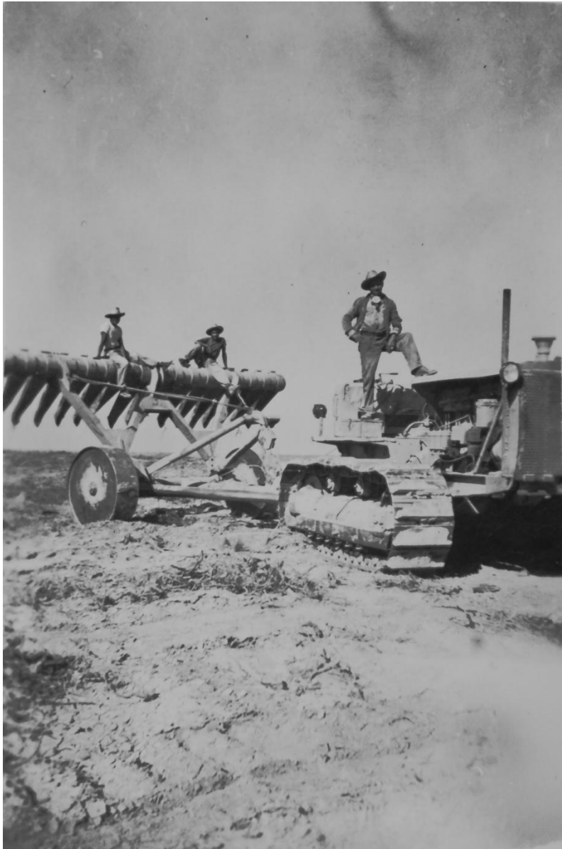
Fotografía de trabajadores de los campos de algodón, tomada por Emiliano. Sur de Estados Unidos.