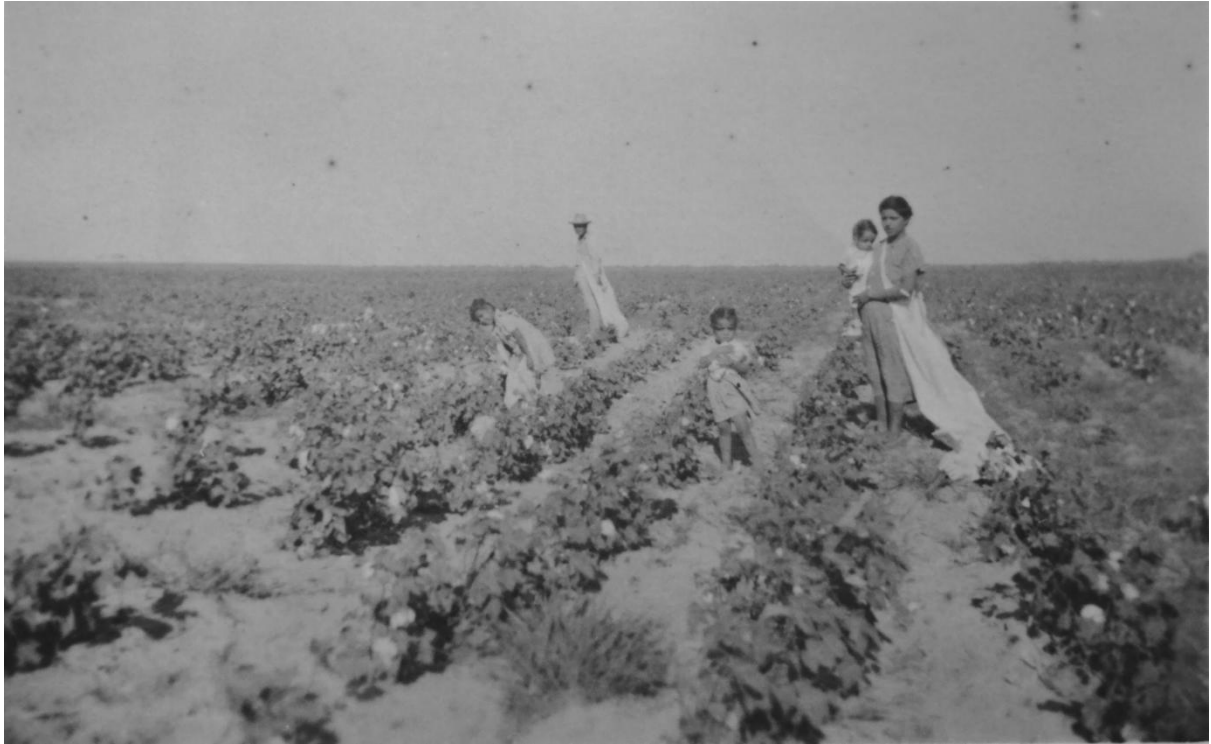
Fotografía de una familia en los campos de algodón, tomada por Emiliano. Sur de Estados Unidos.