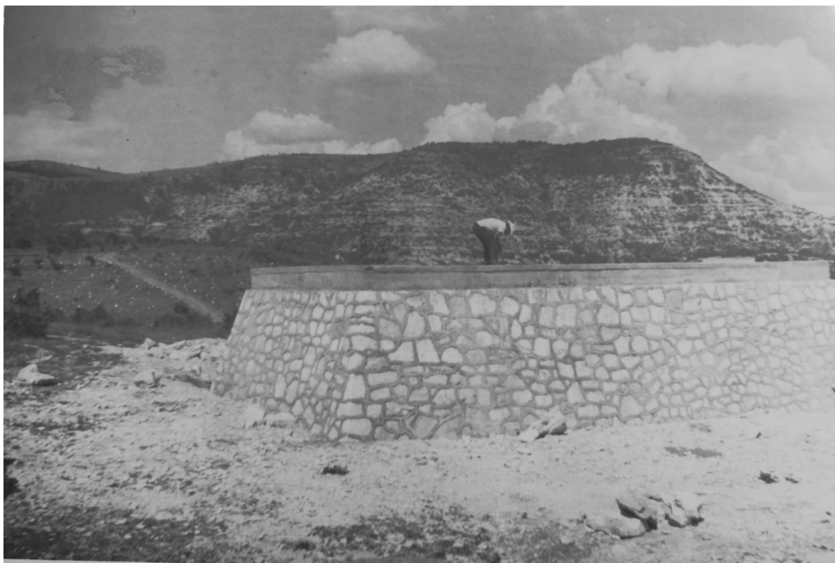
Fotografía de la construcción del pozo. San Juan Totolac, Tlaxcala.