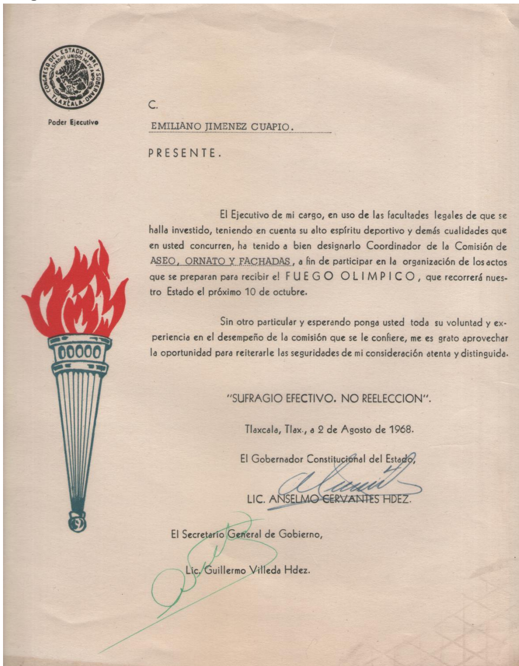
Documento que agradece la organización para el recibimiento del Fuego Olímpico de las Olimpiadas de 1968.