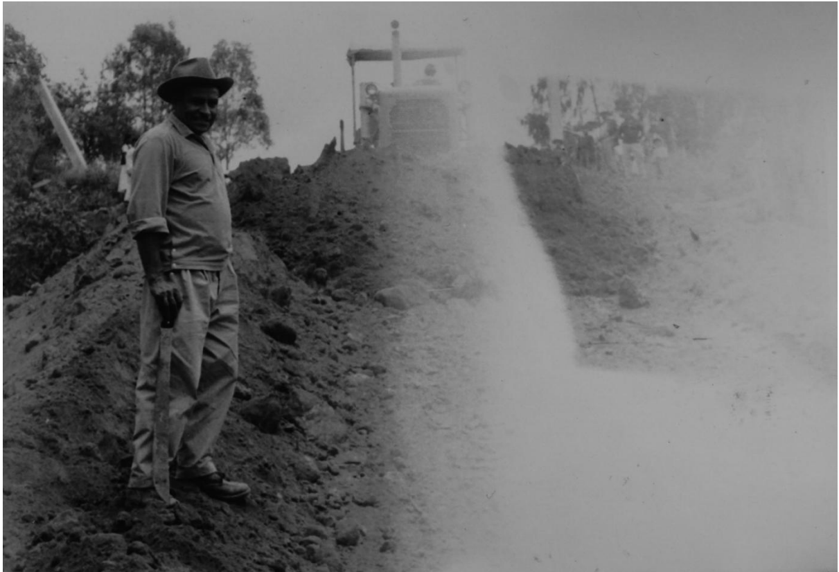
Fotografía de Emiliano parado frente a maquina excavadora en la apertura de las calles. San Juan Totolac, Tlaxcala.